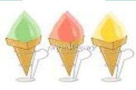
ソニャーレ ジェラート