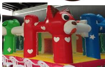
はねて遊べる ふあふが登場